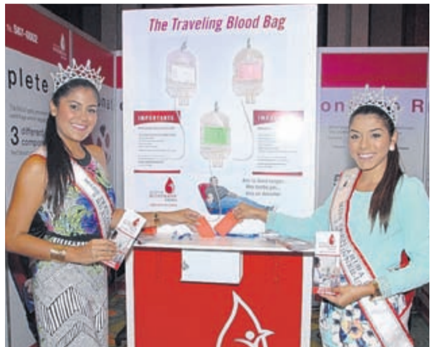
Stichting Bloedbank Aruba (SBA) tabata tin e oportunidad di participa na e Beauty and Health Expo 2015. SBA sigur ta contento di por a participa ya cu danki na e oportunidad aki 173 persona a inscribi pa bira dunado di sanger. Les a B6

Un cantidad grandi di persona a inscribi pa bira dunado di sanger